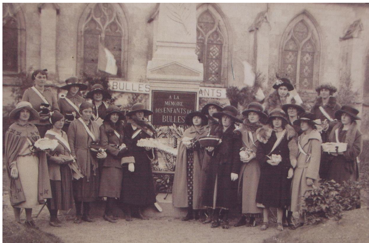
Des jeunes filles de Bulles portant une belle tenue.