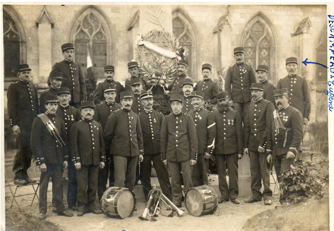
La clique des sapeurs-pompiers